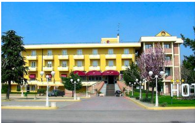
HOTEL POLI a 3 STELLE VIA GIACOMO PUCCINI, 1 42024 CASTELNOVO DI SOTTO (RE) Telefono: 0522.683168