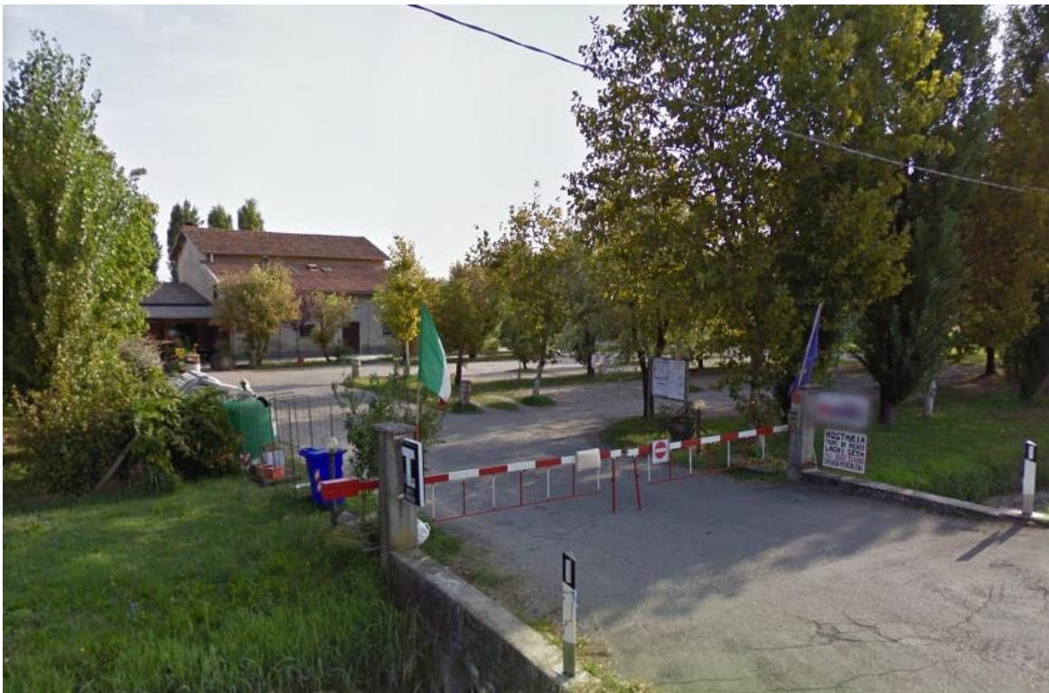
OSTERIA DEI LAGHI DI SETA – VILLA SETA DI CADEL BOSCO DI SOPRA (RE)